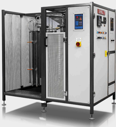
CRI - Coke Reactivity Furnace

Produktvideo: IOR - Iron Ore Reducibility Furnace