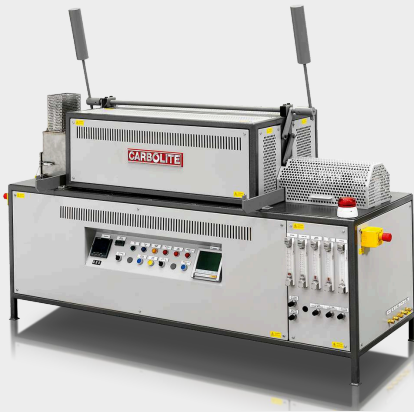
LTD - Niedertemperatur- Reduktions-Zersetzungsofen von Eisenerzen