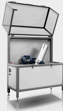
CSR - Coke Strength after Reduction I-Tester/Tumbler