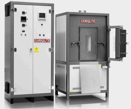
CTO 7 - Kokstestofen mit fester Wand