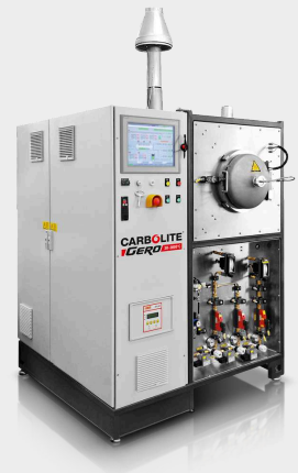
GLO 40/11-1G - Ofen zur Kohlecharakterisierung