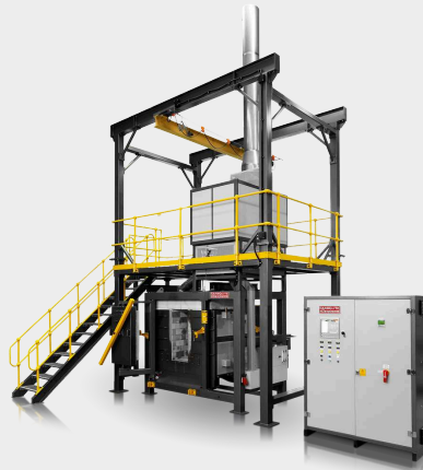
MWO 227 kg -Koksversuchsofen mit variabler Breite