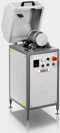
IOT - Eisenerzschleuder