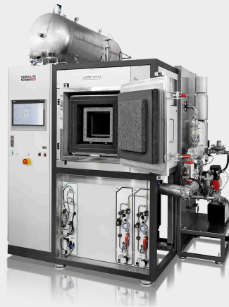
HTK 25 GR/22-1G automatik bis 2200°C mit optionalem Pyrolyse- Paket