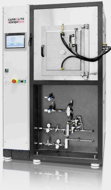
HTK 8 GR/22-1G "smart" bis zu 2200°C