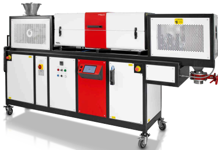
Rotating tube furnace TSR

La serie de hornos tubulares rotatorios TSR de Carbolite cuenta con las mismas prestaciones innovadoras de la serie de hornos tubulares articulados TS y puede procesar lotes grandes de materiales fluidos como los polvos.