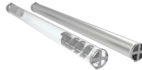
Tubo de trabajo estándar de cuarzo y tubo opcional de metal