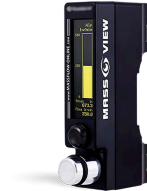
Caudalímetro digital que controla el flujo de gas