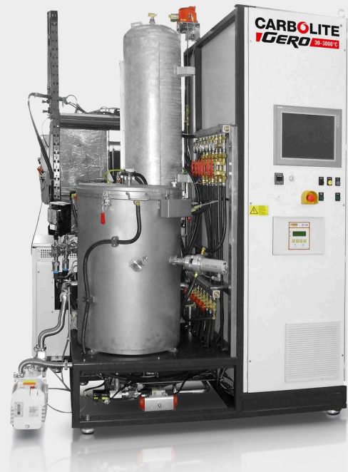
LHTW 200-300/22-1G automático, hasta 2200°C, con paquete para hidrógeno opcional