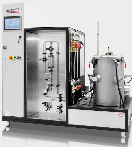
LHTM/W 200-300 Smart