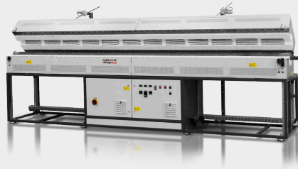
FZS 13/100/4500 de diseño personalizado, de 3 zonas con una longitud de calentamiento de 4500 mm, mecanismo de apertura automática y tubo de trabajo APM