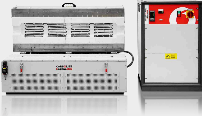
CUERPO DEL HORNO Y UNIDAD DE CONTROL SEPARADOS