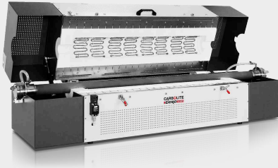
FZS 13/100/1000 con tubo metálico APM