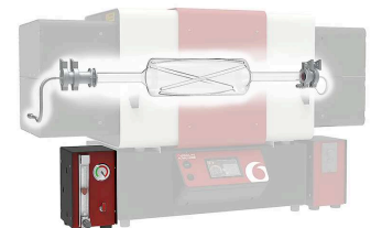
Réacteur rotatif inside of TSO furnace