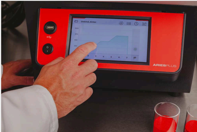
Régulateur à écran tactile CC-T1

Les fours tubulaires rotatifs TSO sont équipés en standard de communications Ethernet et d'un régulateur programmable à 24 segments :