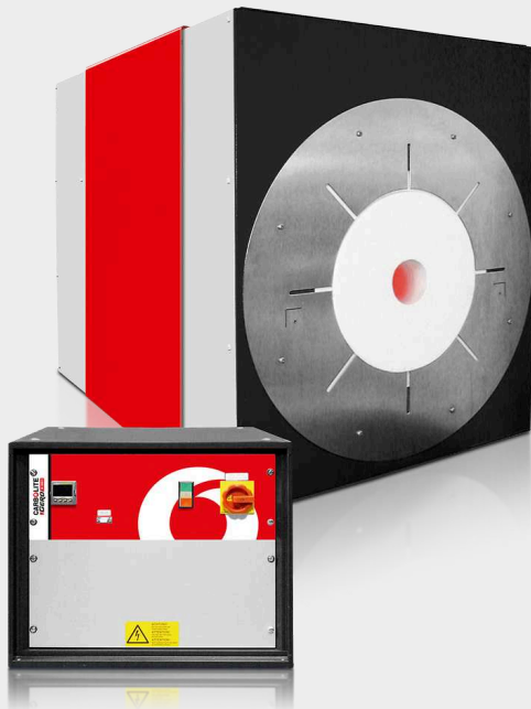
HTRH 18/40/100 con modulo di controllo