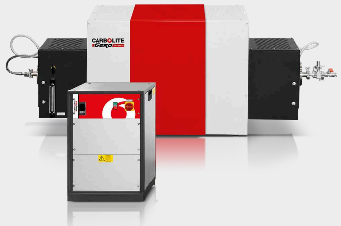
HTRH 17/70/600 con pacchetto gas inerte opzionale, flange per alto vuoto e programmatore E3508P10