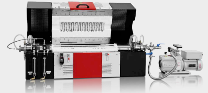
Pacchetto gas inerte FZS 13/70/ 500 per Ar e gas reattivo O 2 dotato di pompa rotativa a doppio stadio