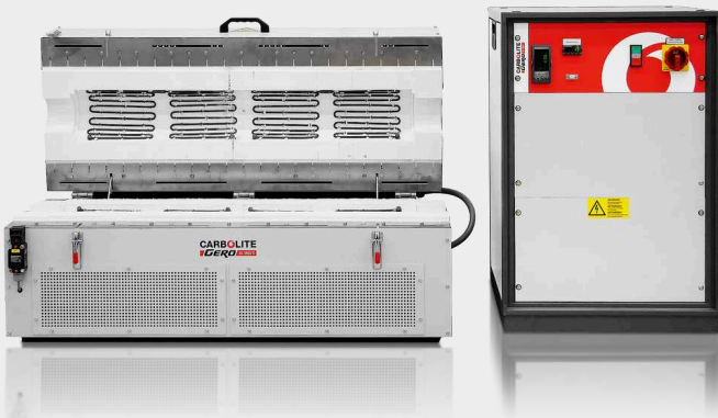
CORPO DEL FORNO E CONTROL BOX SEPARATI