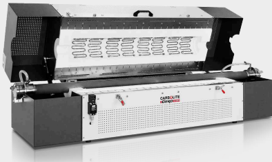
FZS 13/100/1000 con tubo metallico APM