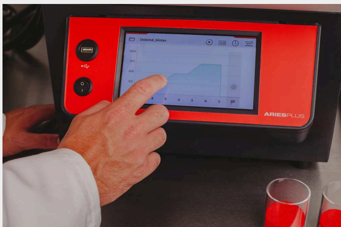
СС-ТТ Контроллер с сенсорным экраном

Трубчатые вращающиеся печи TSO стандартно оснащены портом для подключения к Ethernet и программируемым контроллером с 24 сегментами: