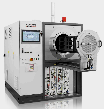
Автоматическая печь GLO 120/11-IG до 1100 °С с дополнительным водородным пакетом и выезжающей дверцей