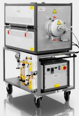
GLO 10/11-IG: компактная печь с горячими стенками с ретортой из нержавеющей стали и дополнительной ретортой из инконеля (до 750 °С в вакууме и до 1100 °С при нормальном давлении)