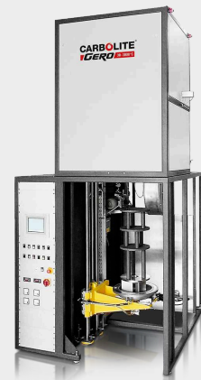
VGLO - вертикально установленная версия печи GLO