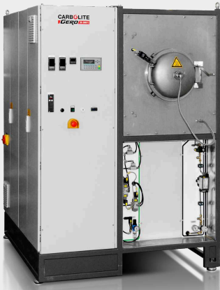
GLO 40/11-1G semi-automat până la 1100°C