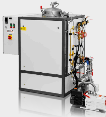
VGLO cu încărcare superioară 10/ 11-1G manual până la 1100°C cu pompă de vid opțională (750°C max.)