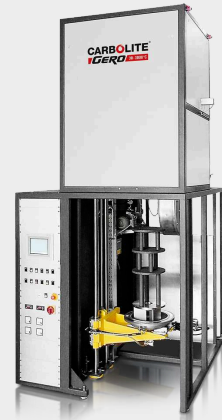
VGLO - versiune montată vertical a GLO