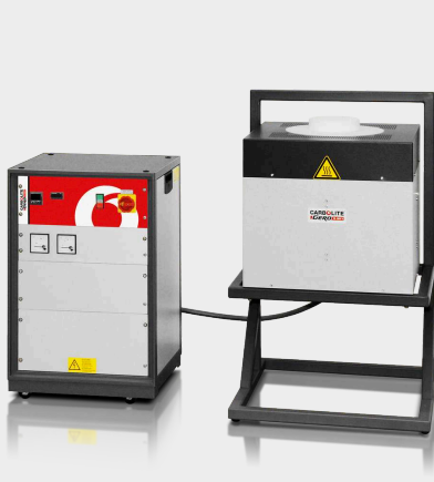
HTRV 17/150/250 cu sistem opțional L-stand