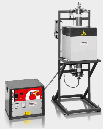
HTRV 18/70/250 cu pachet opțional de gaz inert, flanșe de vidare înaltă, programator E3508P10 și afișaj curent / tensiune