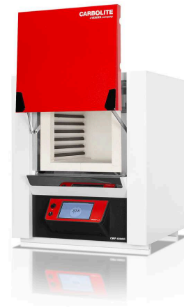
CWF 13/36 with AriesPlus temperature controller