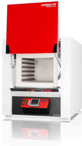
CWF 13/65 with nanodac temperature controller