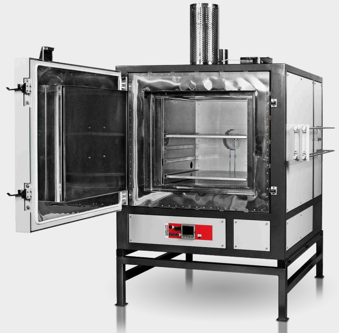
HTMA 6/220 met nanodac-programmeerapparaat, automatische gasregeling en zuurstofbewakingsopties