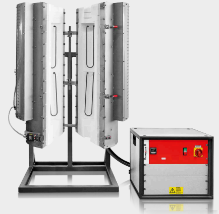
HTRV-A 17/100/700 s voliteľným L- stojanom

Výhrady k technickému riešeniu a nedostatkom