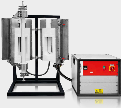
HTRV-A 17/70/250 s voliteľným stojanom a voliteľnou pracovnou rúrkou