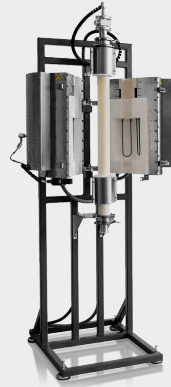
HTRV-A 17/70/250 with inert gas package