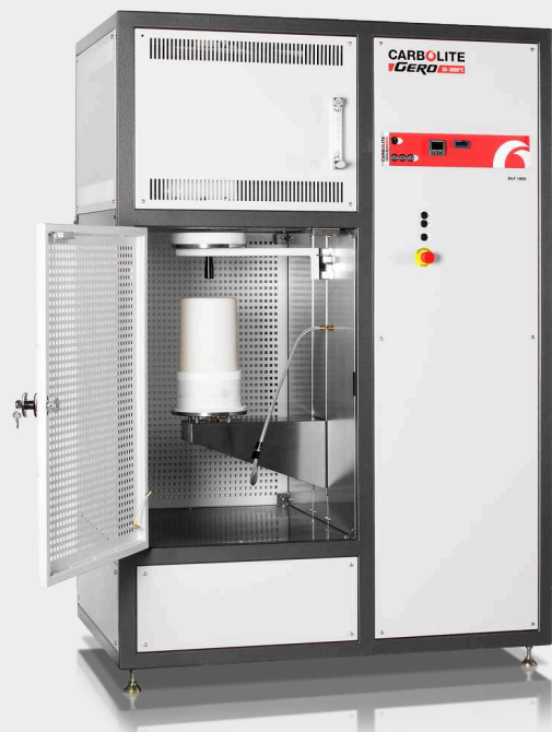
BLF 18/8 com cadinho invertido, medição de fluxo de gás e opções de obturador de radiação