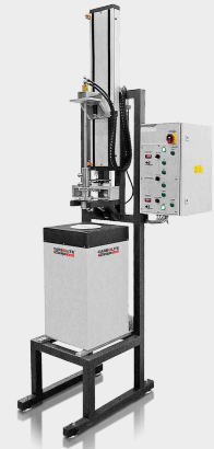
Forno Brigman padrão até 1800°C