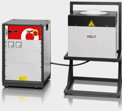
HTRV 17/150/250 com suporte L opcional