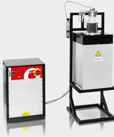
HTRV 18/100/500 com pacote opcional de gás inerte e tubo de cerâmica fechado de um lado