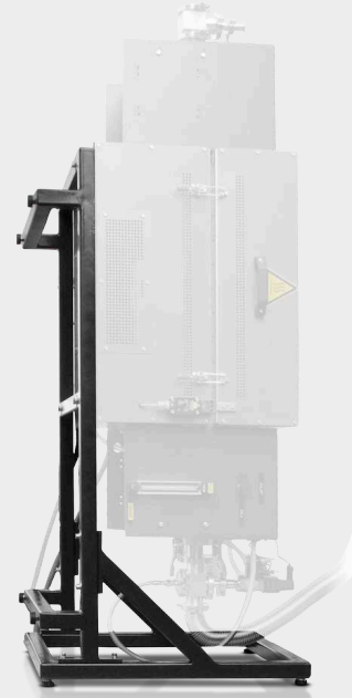
OPCIÓ: FÜGGŐLES ÁLLVÁNY