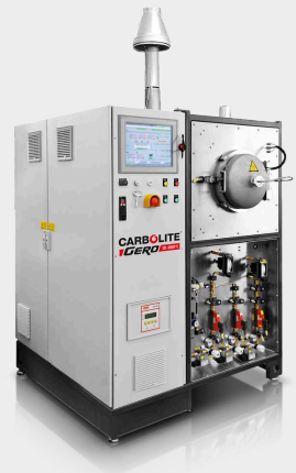
GLO 40/11-IG - Szénvizsgáló kemence