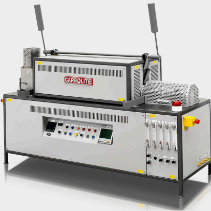
LTD - Alacsony hőmérsékletű redukció - vasérc bontása