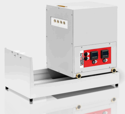
GK - Szürke király koksztüzelő kemence