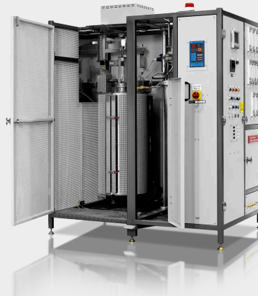
IOR - vasérc redukálhatósági kemence