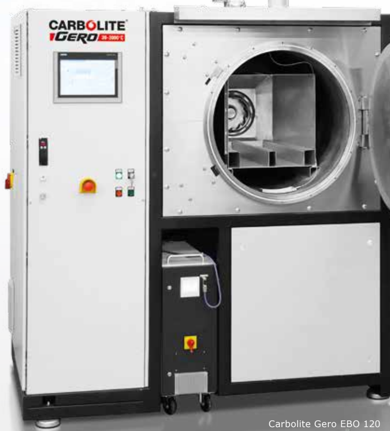
Carbolite Gero EBO 120