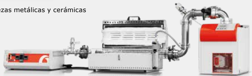
Carbolite Gero HZS 12/600