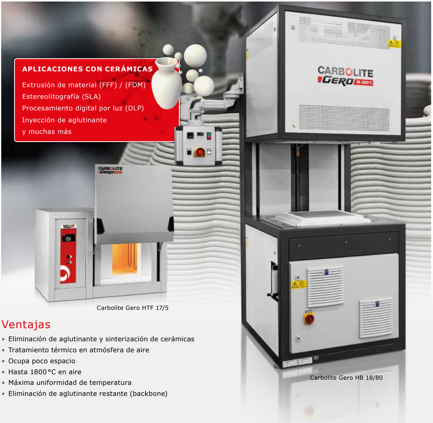
Carbolite Gero HTF 17/5